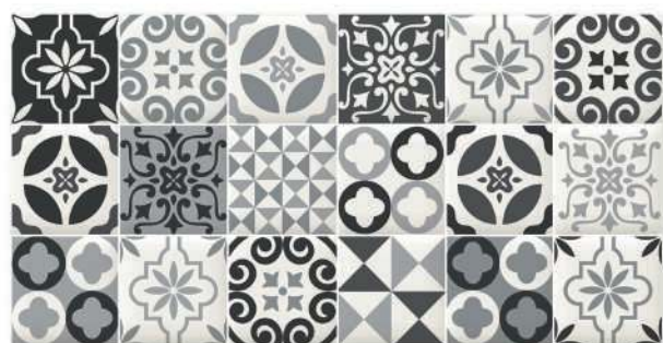
Decor Cairns Black