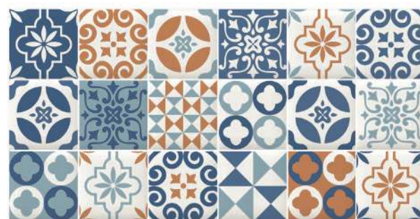
Decor Cairns Blue

30 x 60 CM (Pre-cut 10 x 10 cm) / DIFFERENT DESIGNS IN EACH BOX