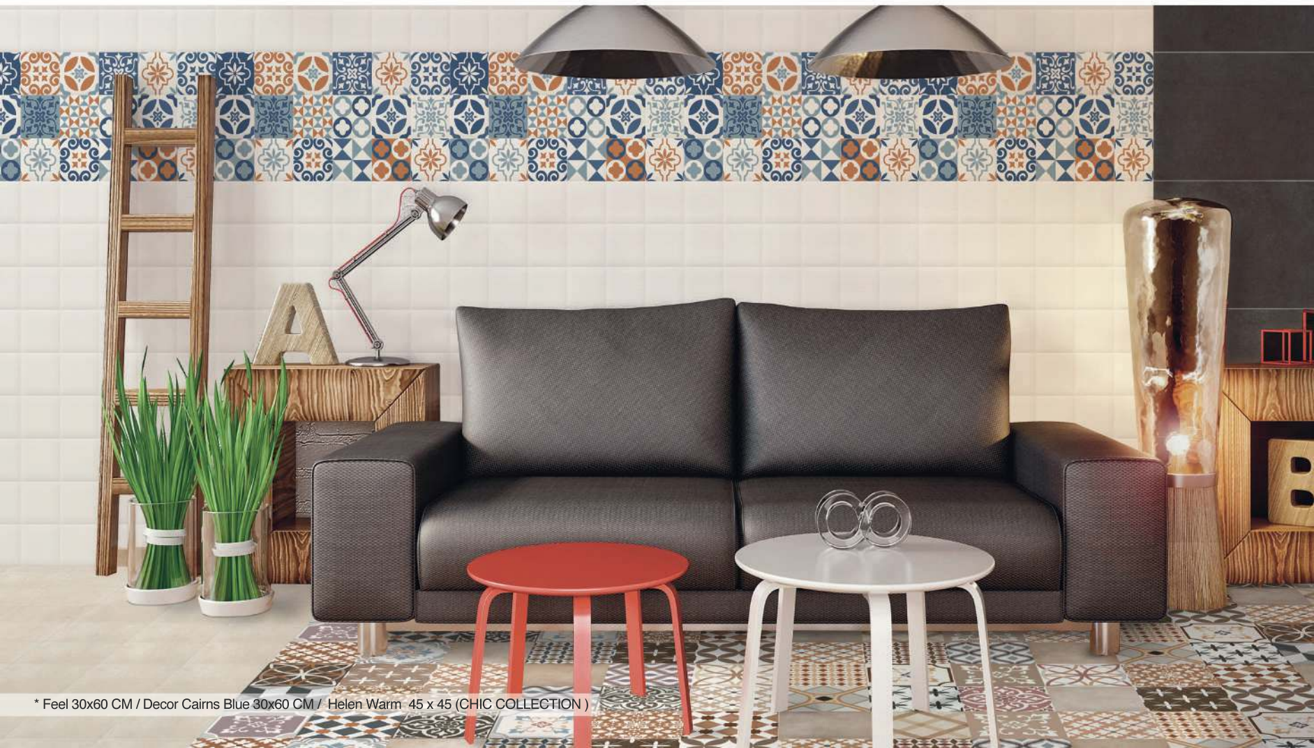
* Feel 30x60 CM / Decor Cairns Blue 30x60 CM / Helen Warm 45 x 45 (CHIC COLLECTION)