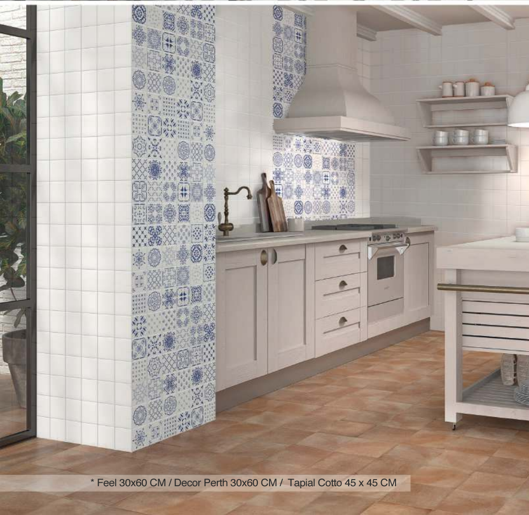
* Feel 30x60 CM / Decor Perth 30x60 CM / Tapial Cotto 45 x 45 CM