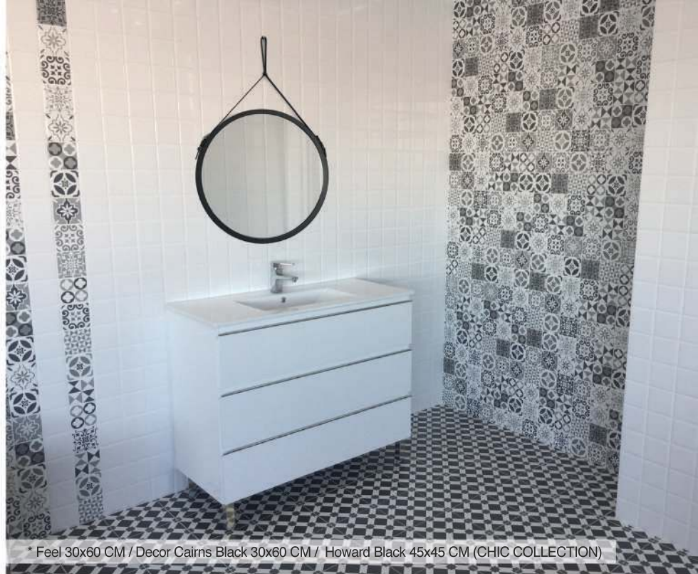
* Feel 30x60 CM / Decor Cairns Black 30x60 CM / Howard Black 45x45 CM (CHIC COLLECTION)