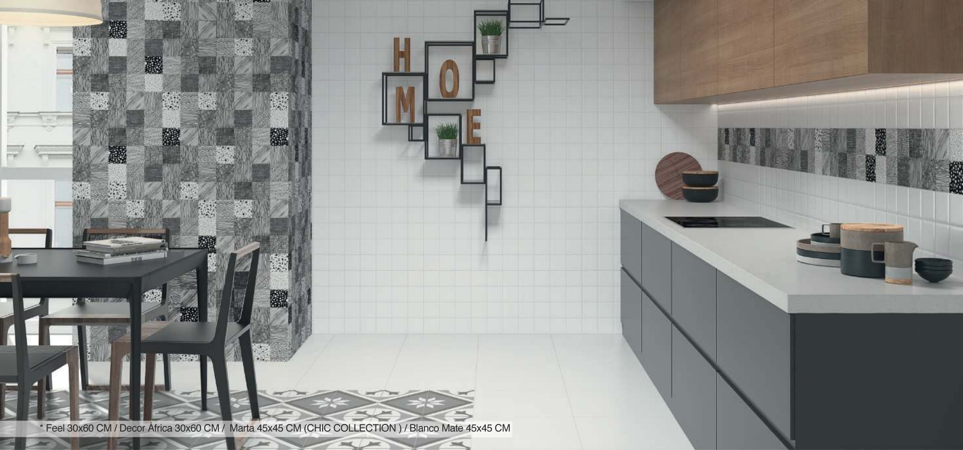
* Feel 30x60 CM / Decor África 30x60 CM / Marta 45x45 CM (CHIC COLLECTION) / Blanco Mate 45x45 CM