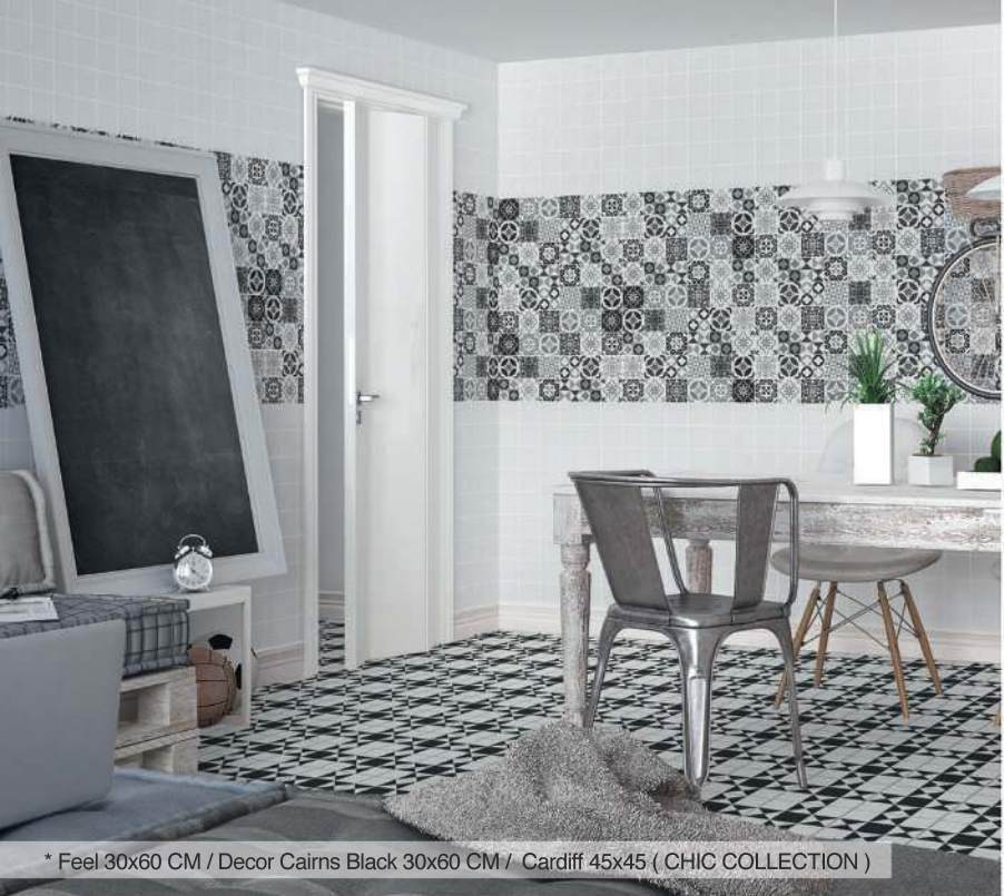
* Feel 30x60 CM / Decor Cairns Black 30x60 CM / Cardiff 45x45 ( CHIC COLLECTION )