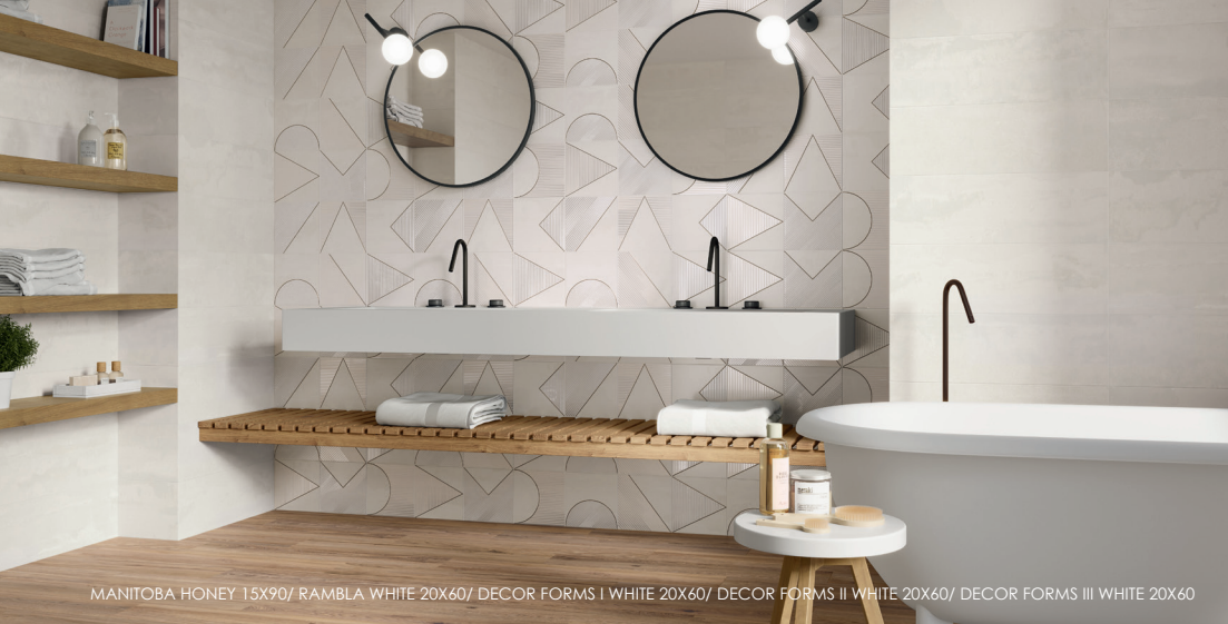
MANITOBA HONEY 15X90/ RAMBLA WHITE 20X60/ DECOR FORMS I WHITE 20X60/ DECOR FORMS II WHITE 20X60/ DECOR FORMS III WHITE 20X60