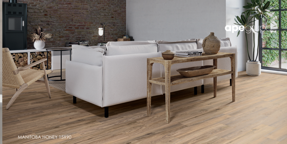
MANITOBA HONEY 15X90