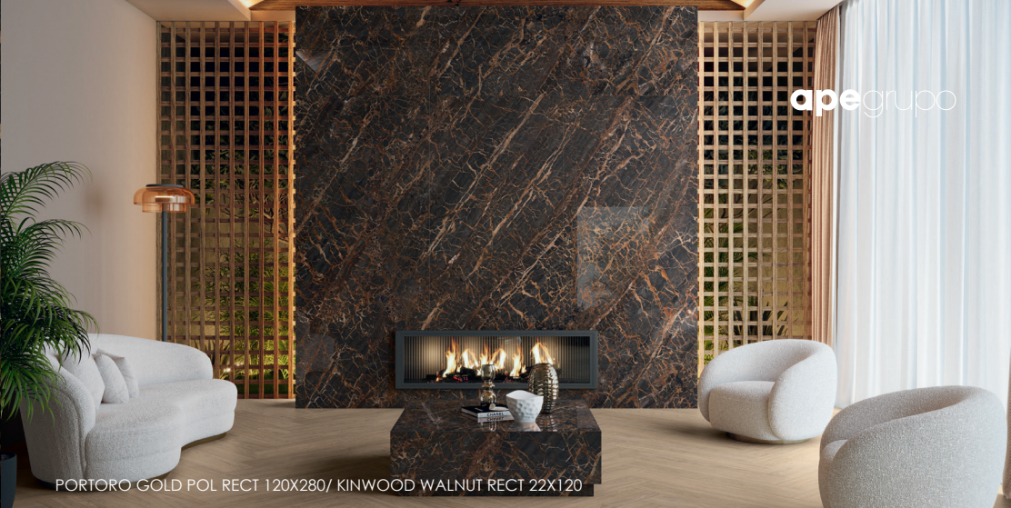
PORTORO GOLD POL RECT 120X280/ KINWOOD WALNUT RECT 22X120