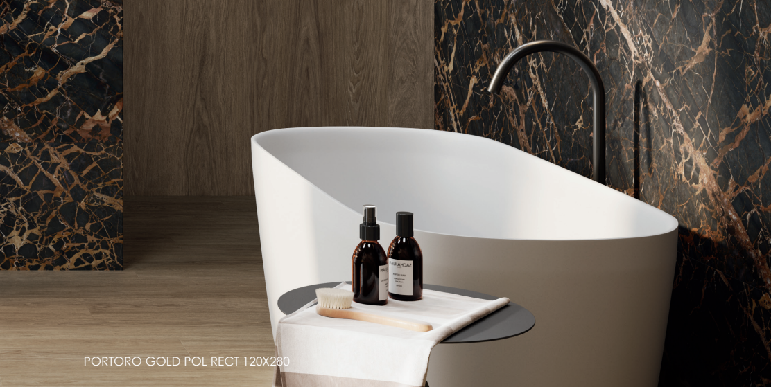
PORTORO GOLD POL RECT 120X280