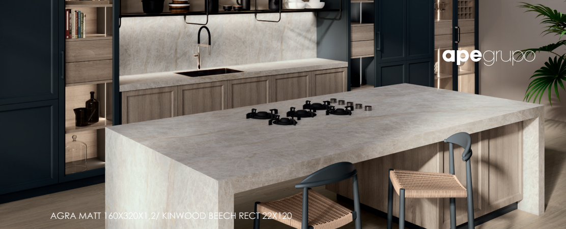
AGRA MATT 160X320X1,2/ KINWOOD BEECH RECT 22X120