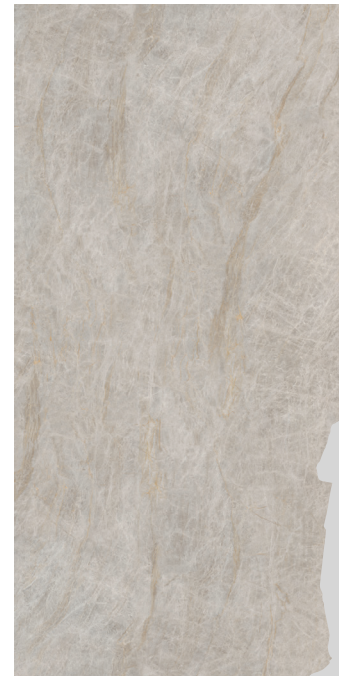
AGRA MATT 160X320X1,2/64"X126"X0,5" M80/M