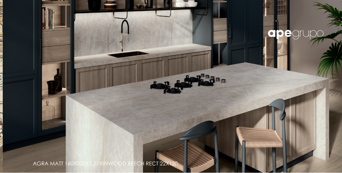
AGRA MATT 160X320X1,2/ KINWOOD BEECH RECT 22X120