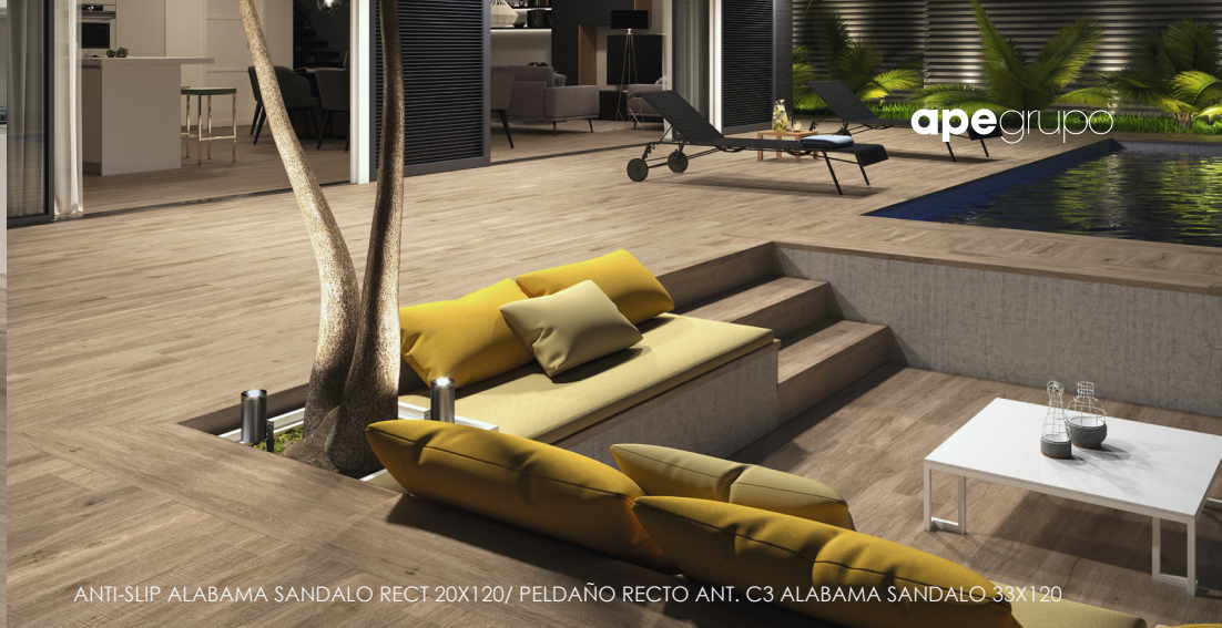
ANTI-SLIP ALABAMA SANDALO RECT 20X120/ PELDAÑO RECTO ANT. C3 ALABAMA SANDALO 33X120