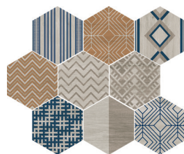
DECOWOOD WHITE MIX 25X29/10"X11" R96/M