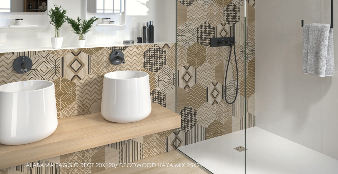
ALABAMA FAGGIO RECT 20X120/ DECOWOOD HAYA MIX 25X29