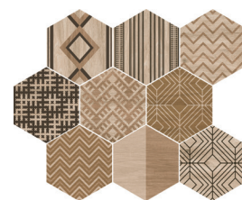
DECOWOOD HAYA MIX 25X29/10"X11" R96/M