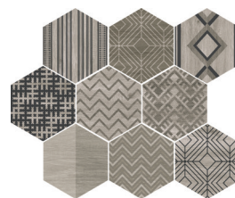
DECOWOOD SNOW MIX 25X29/10"X11" R96/M