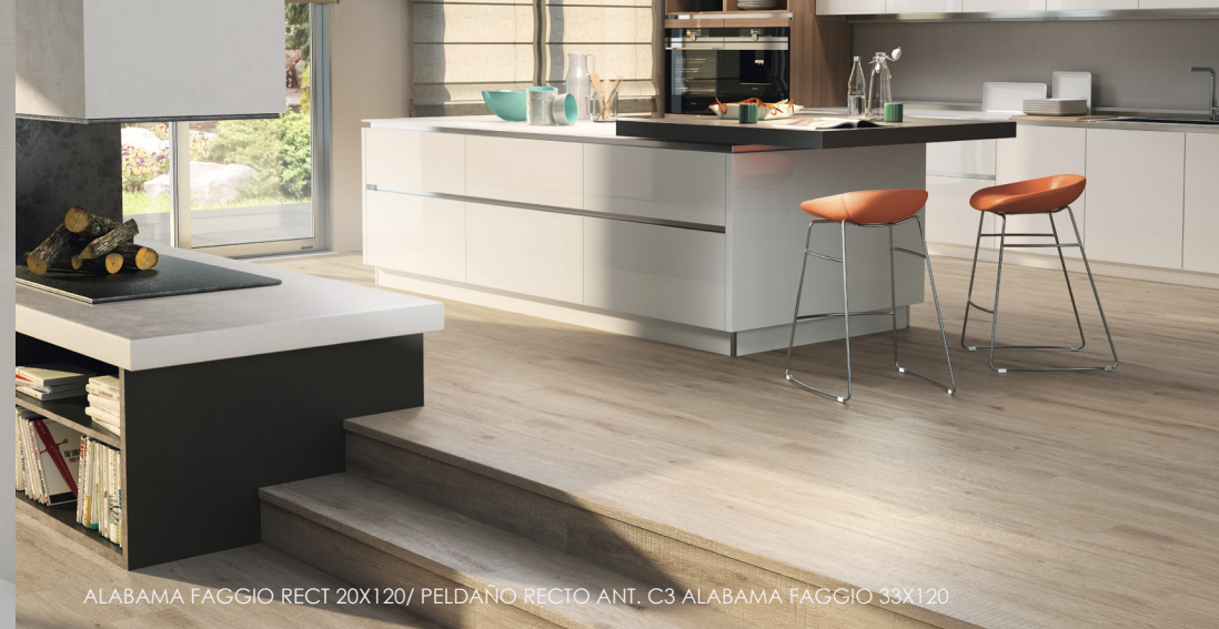
ALABAMA FAGGIO RECT 20X120/ PELDAÑO RECTO ANT. C3 ALABAMA FAGGIO 33X120